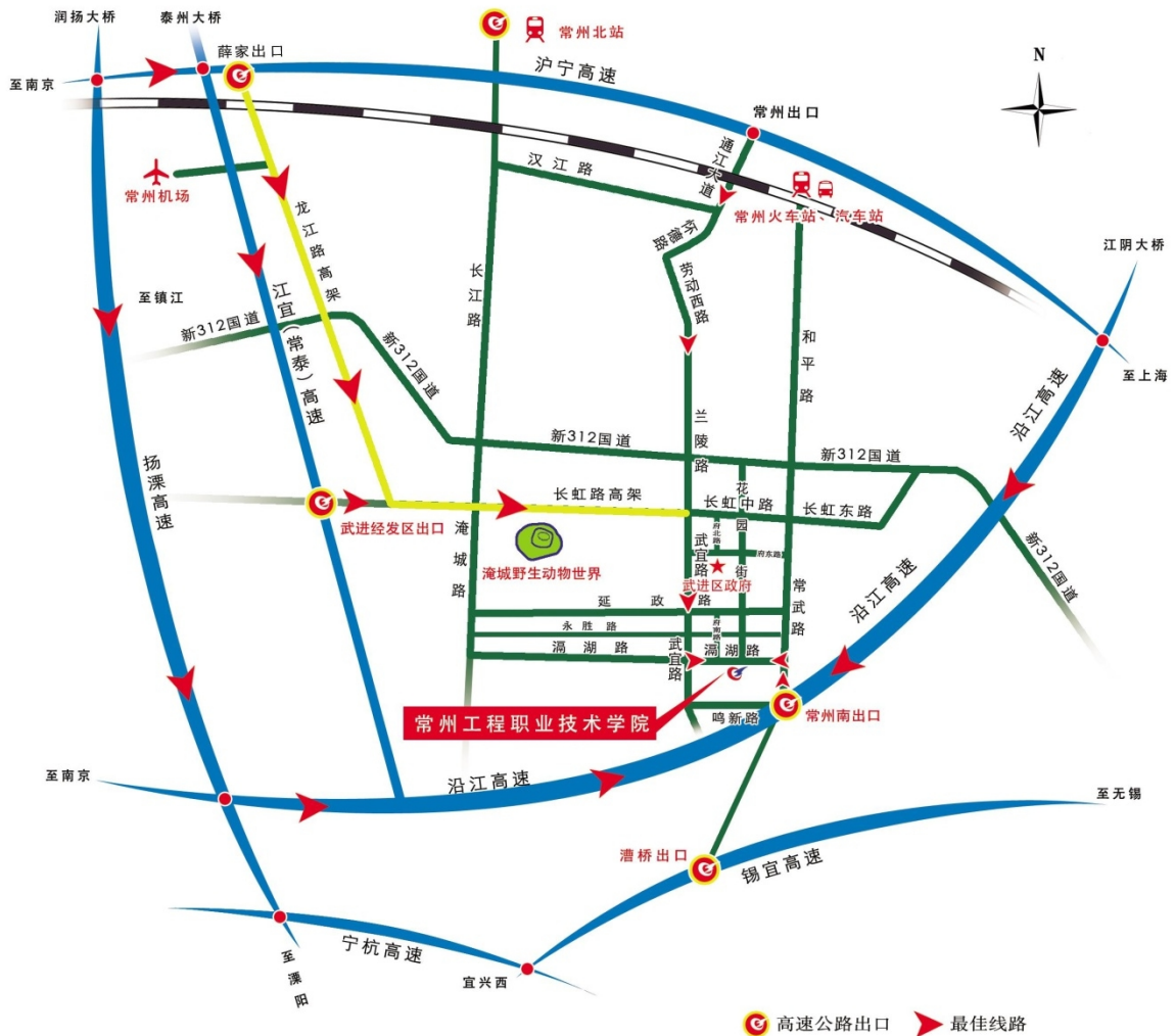
常州工程职业技术学院周边交通示意图

(1) 沪宁高速薛家出口下，从市区方向直接上龙江高架快速路到和平南路（常武路）出口下，右转上常武路，直行约 1 公里右转至滆湖中路，继续直行约 2 公里到达学院。